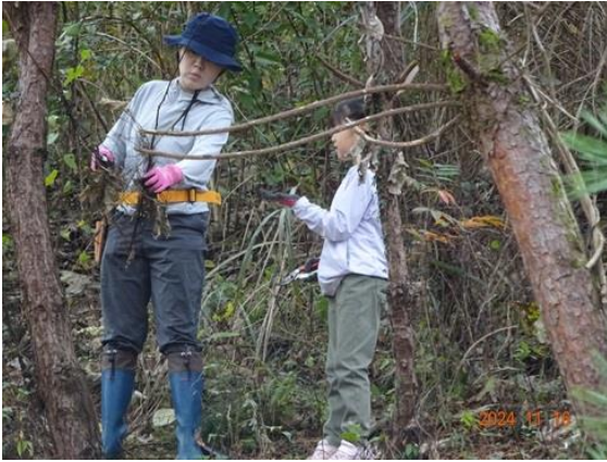
親子でマツの枝打ち作業