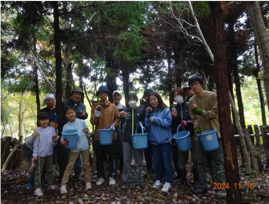
シイタケ狩り体験できました。