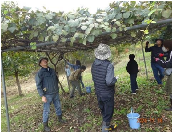
キウイフルーツの収穫作業