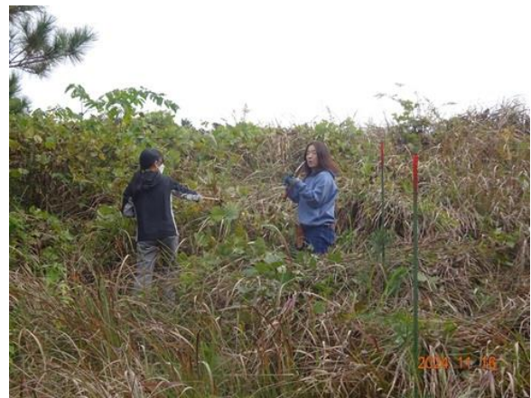
クロマツの苗木を探し出す