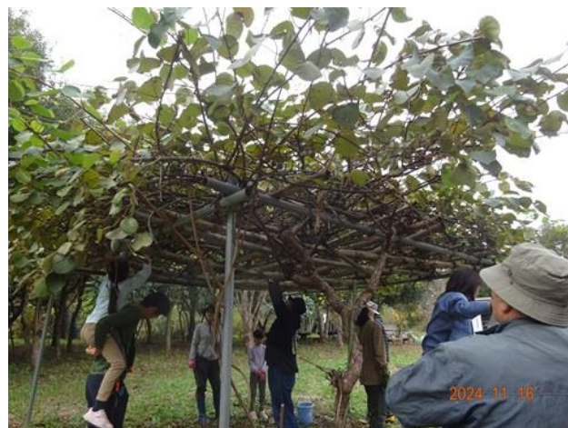
手を伸ばして収穫