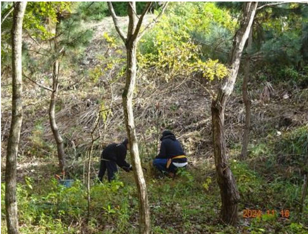
クロマツの苗木保護