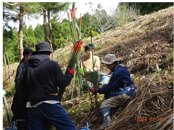
クロマツ苗の支柱立て作業