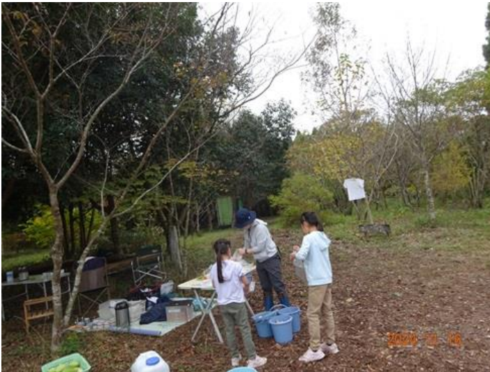
お土産用のシイタケ・キウイフルーツの袋詰め作業