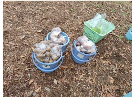
採れたてのシイタケ