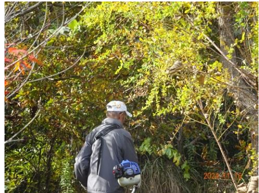
刈払機による草刈