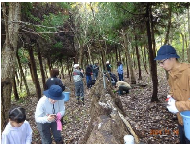
シイタケの収穫作業