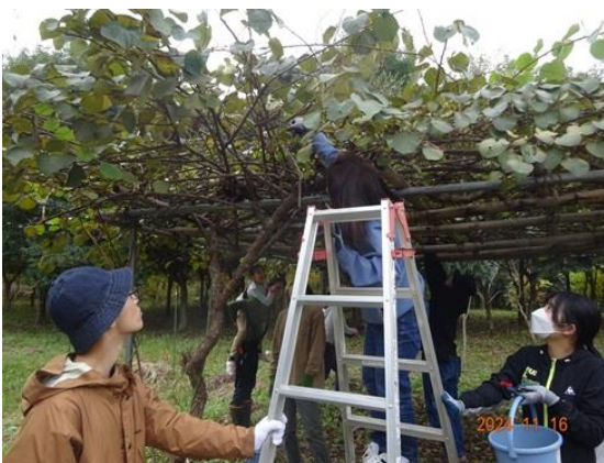
脚立に登って収穫