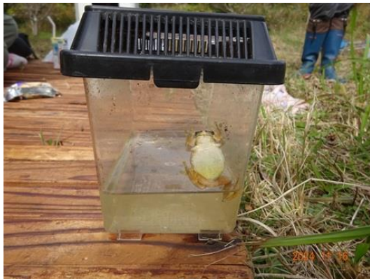
アマガエルのお腹