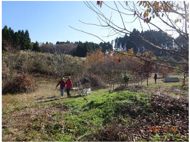
焼却場の整理作業