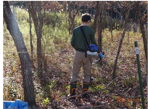
刈払機による除草作業