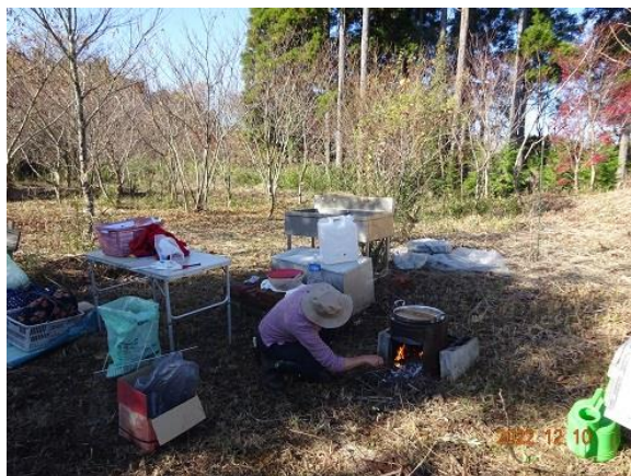
お汁粉用の釜と餅を焼く焚火台