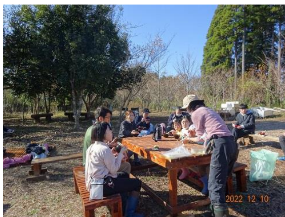
休憩 お汁粉を食べる