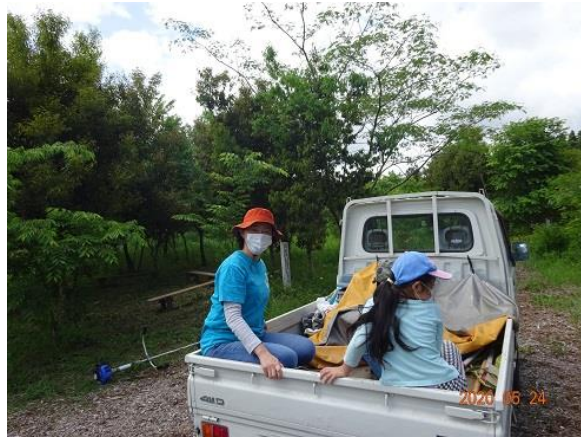
散策路巡りに出発・進行