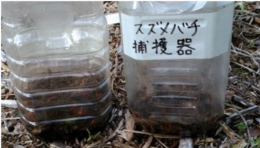
スズメバチトラップ回収