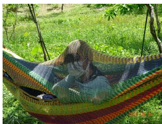
久しぶりのハンモック 楽しそう