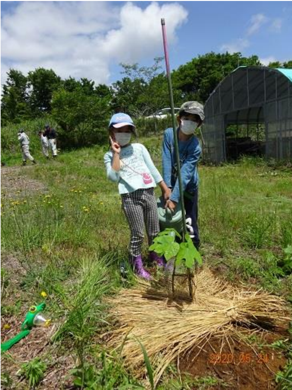
ミニグリーンウェイブ植樹