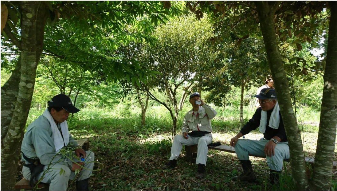
木陰で密集を避けながらの休憩