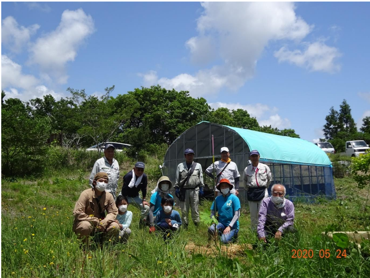
植樹した被爆アオギリ2世の前で集合写真

次回の定例会は、6月27日(土)(雨天の場合6月28日(日))作業は午前中のみとし、除草作業、苗木の枝の剪定、間伐材の片づけなどを行います。