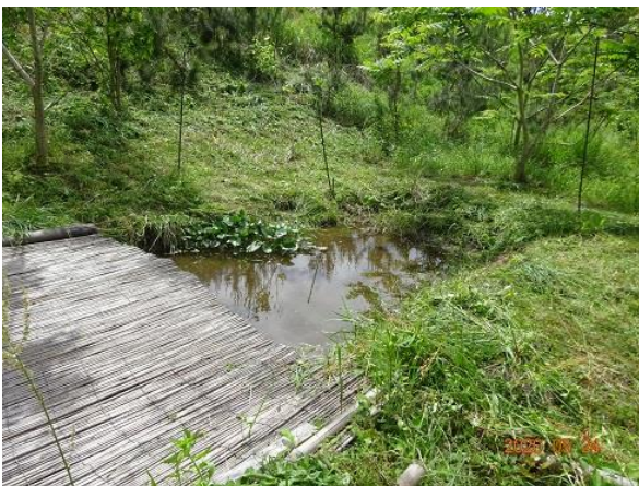
池にはメダカがいました。