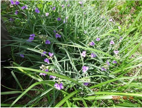
オオムラサキツユクサ