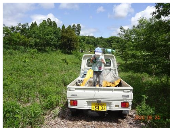
散策路からの風景