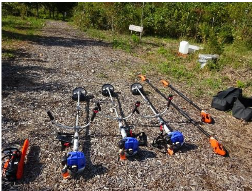
刈払機3台、高枝チェーンソー2台、小型チェーンソー1台購入