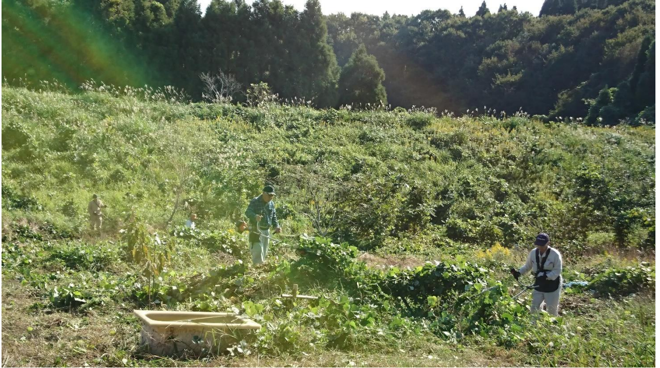
土地改良区の方々は東斜面を