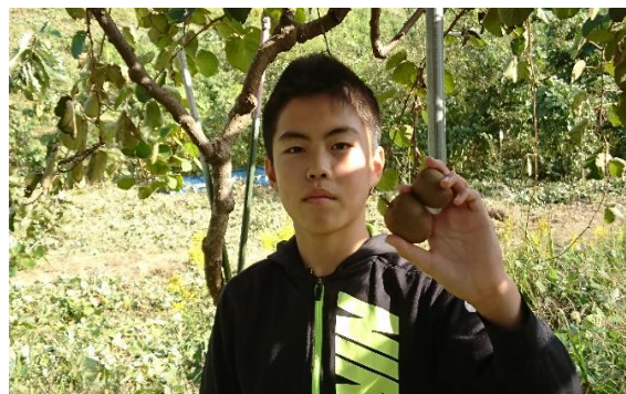
キウイも実っていました