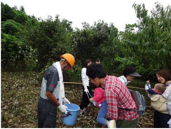
みんなで栗の収穫