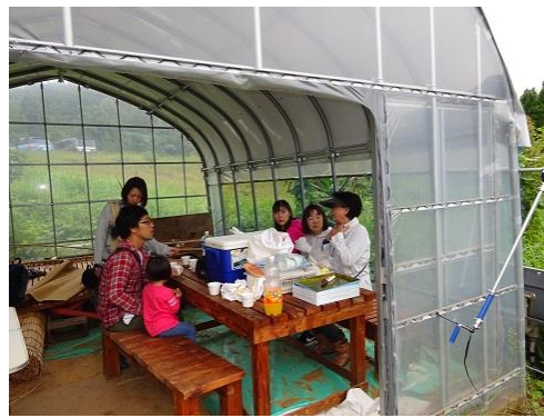
ビニールハウスでの昼食