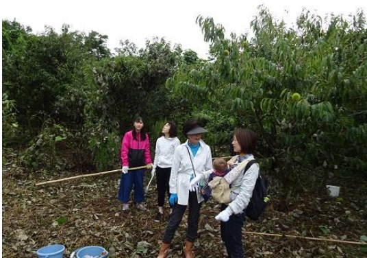
竿による栗の収穫