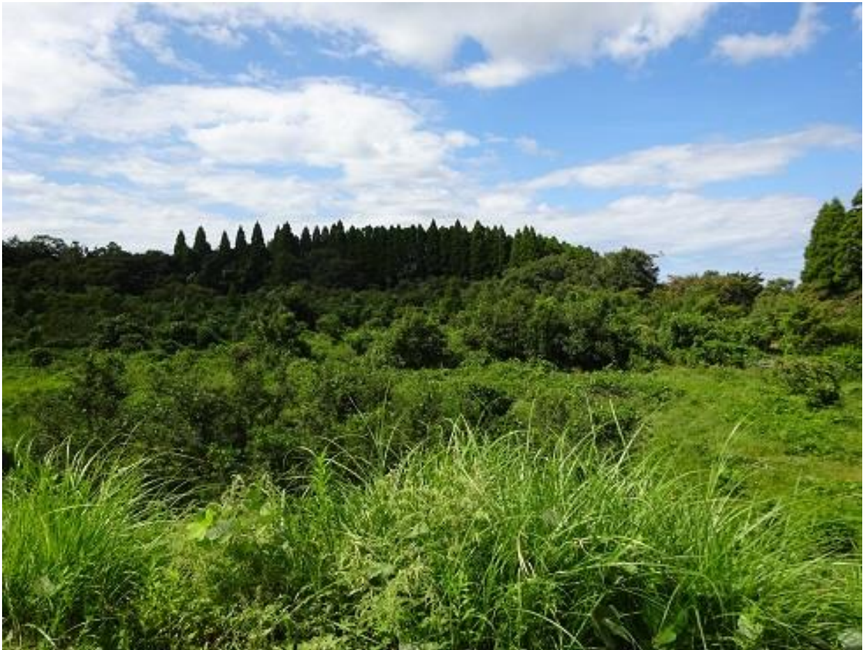
ジャングル状態になっている当地