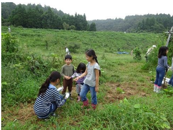
6年生のお姉さん、みんな大好きです。