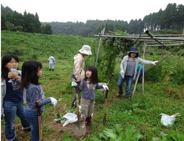
植える場所決まったかな？