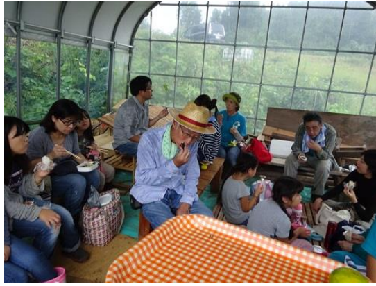
ビニールハウスで昼食