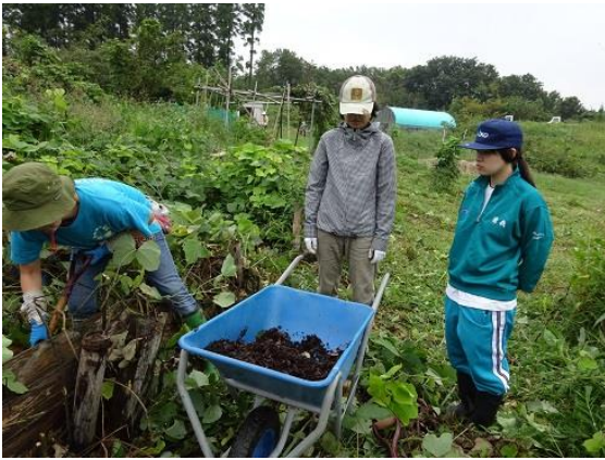
クズに覆われた堆肥場