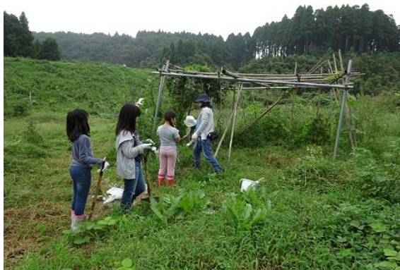
さあ～どこに植えましょう。