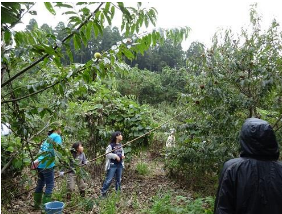
竹竿でクリを落とします。