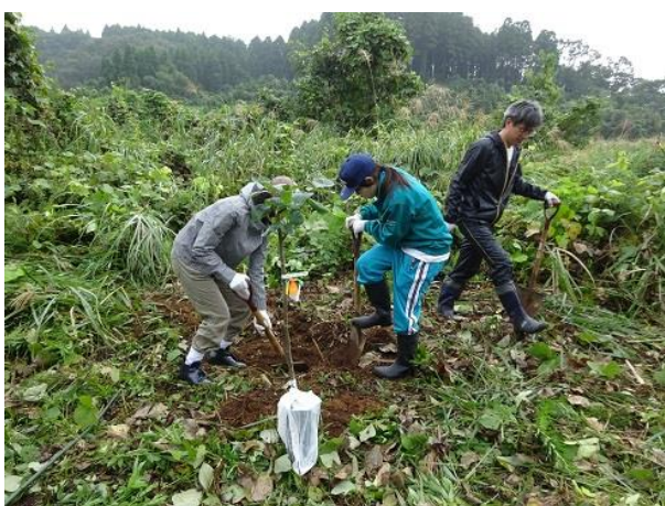
ボランティアの皆さん、頑張って！