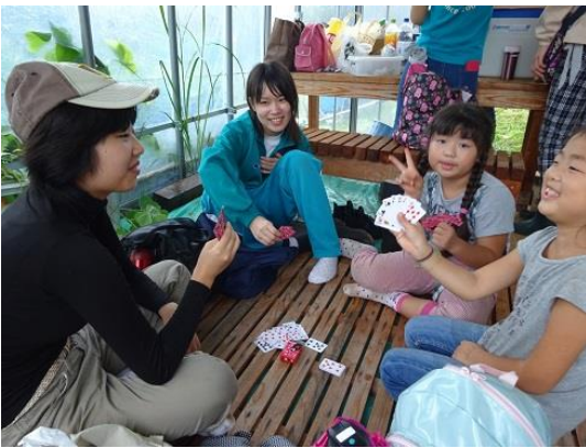
トランプゲーム楽しそう