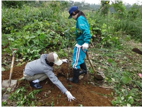
カキの苗木を植えました。