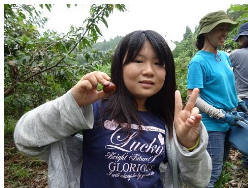
ツヤツヤのクリが採れたよ！