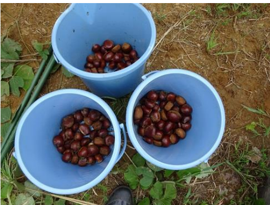
こんなに採れました。