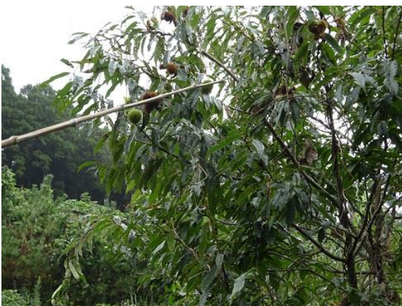
クリのイガ、まだ青いものもある