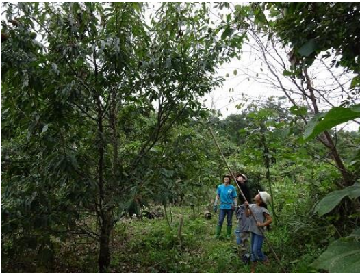
クリの木もこんなに大きくなりました。