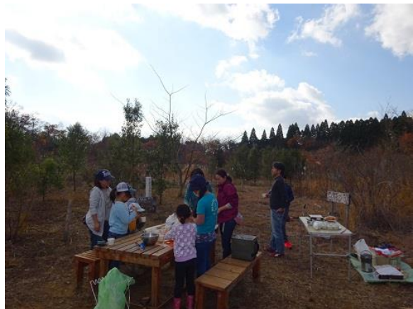
水炊きと焼き芋作り