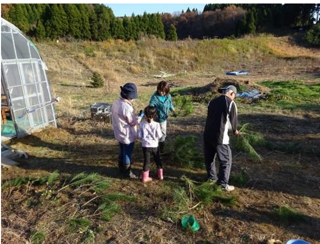
手分けして松とりと紙垂作り