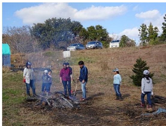
たき火で暖をとりながら焼き芋作り