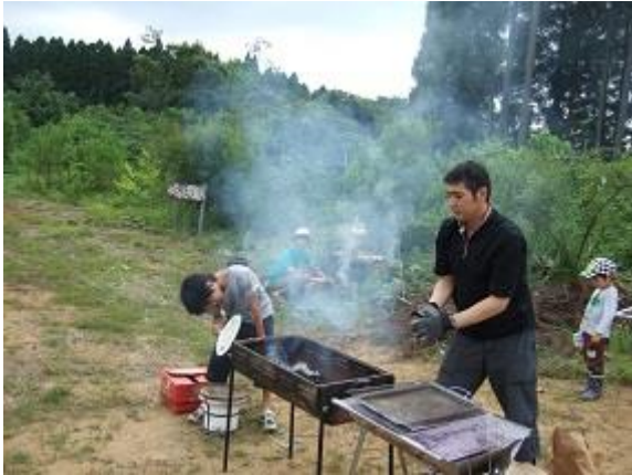
バーベキューの準備