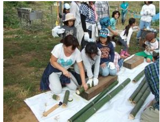
お母さんと一緒に