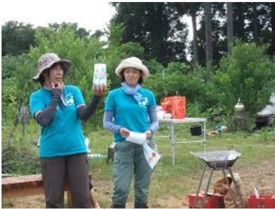
竹のランタン作りの説明