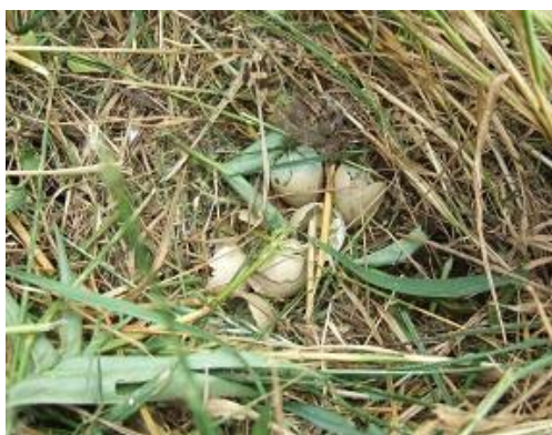
キジの卵の抜け殻発見!