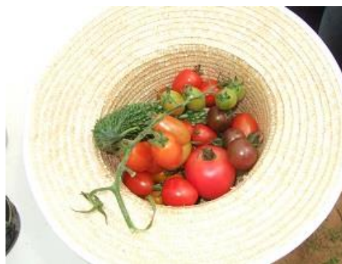
収穫されたゴーヤとトマト