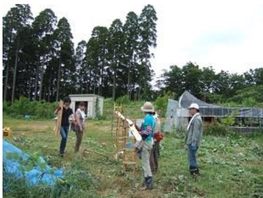
流しそうめん台の設営