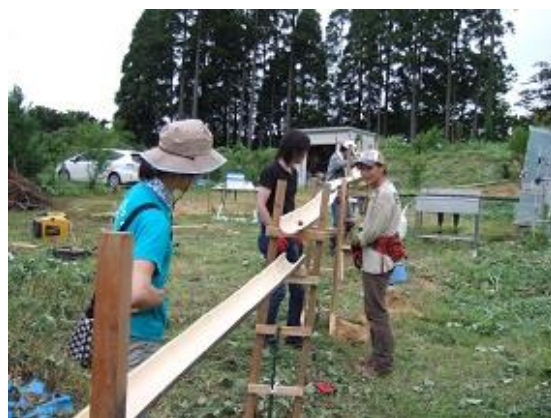
試にミニトマトを転がしてみる