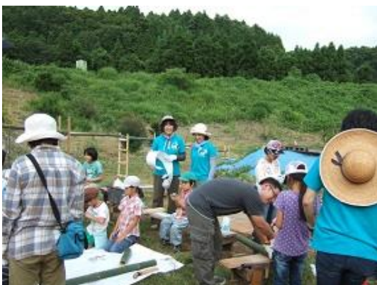
親子でランタンを仕上げ