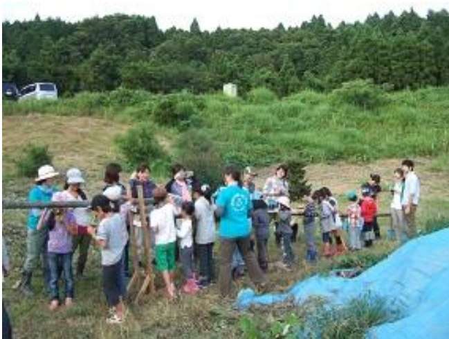
流しそうめん、食べるペースに流すのは難しい！