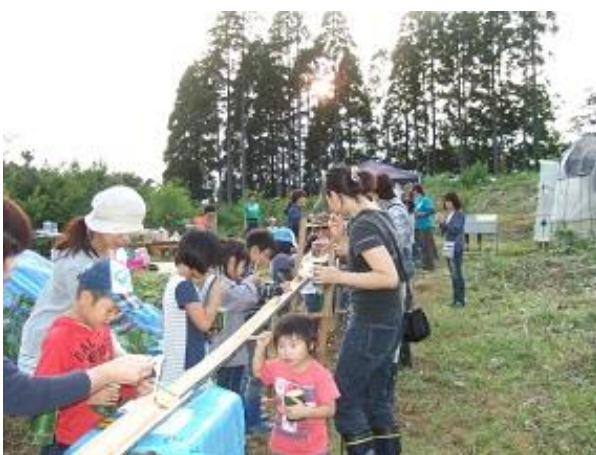
流す方も食べる方も一生懸命