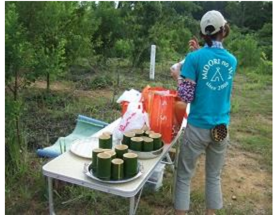
竹の容器と箸を熱湯消毒