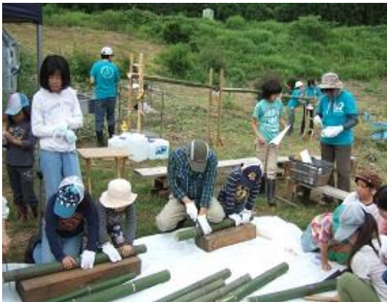
ノコギリで竹を切る