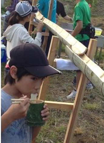
竹の器と箸で食べるから格別！