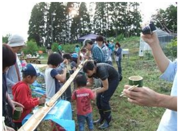
ブドウやゼリーも流れて来たよ