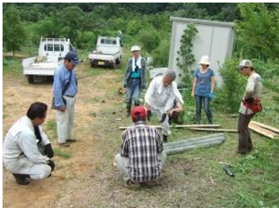
竹の切り方で談笑