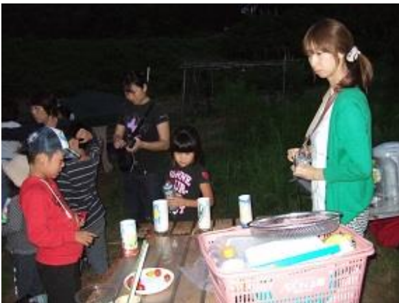
出来上がったランタンを満足そうに見つめる参加者