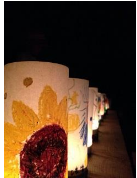
キャンドルに火を灯す