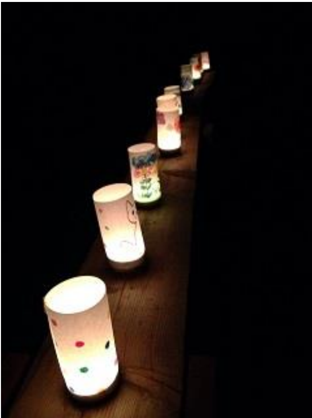
アートギャラリーのようです。