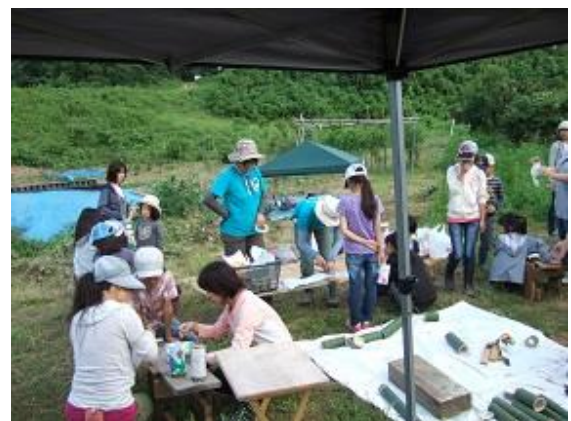
出来上がりが楽しみ