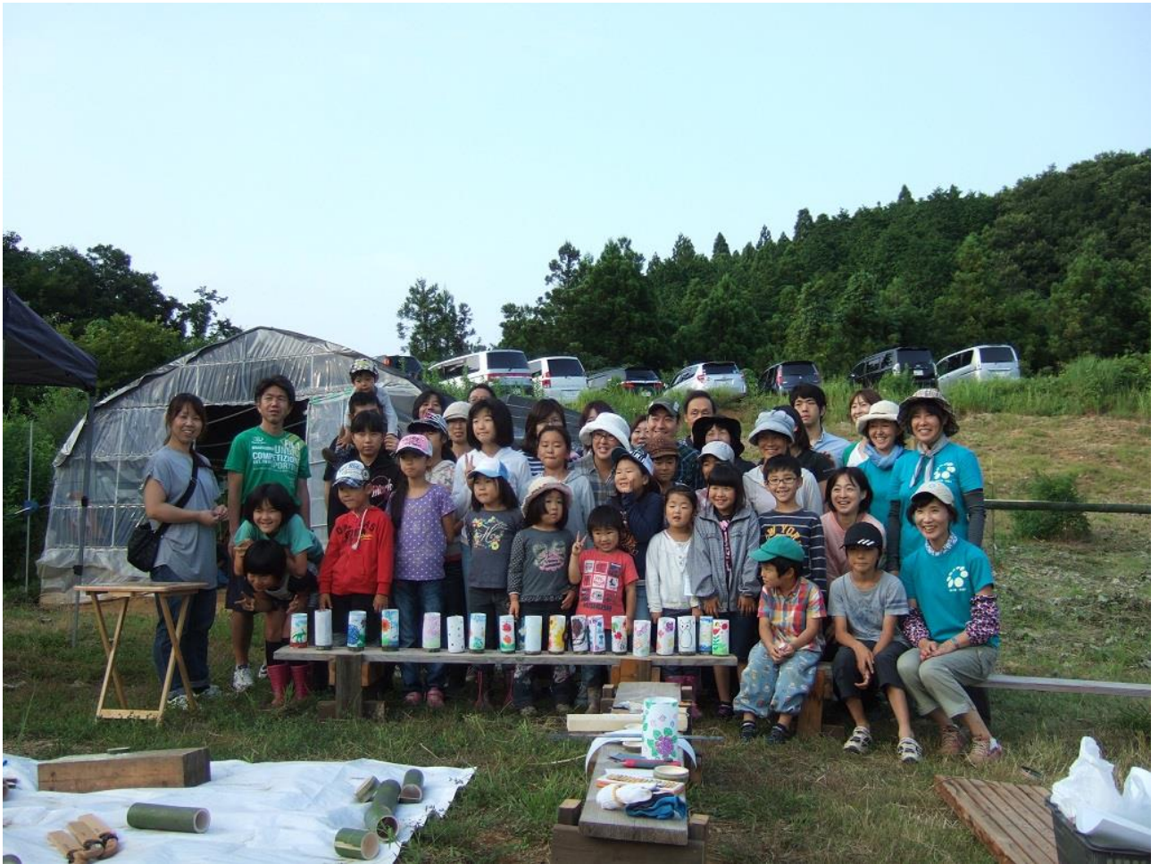
デイキャンプ集合写真