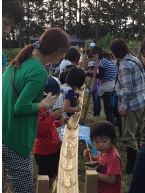
そうめんが流れて来ない？