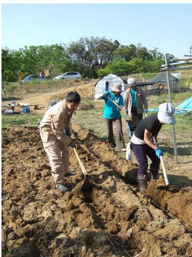
鋤やトンビ鋤で畝立て