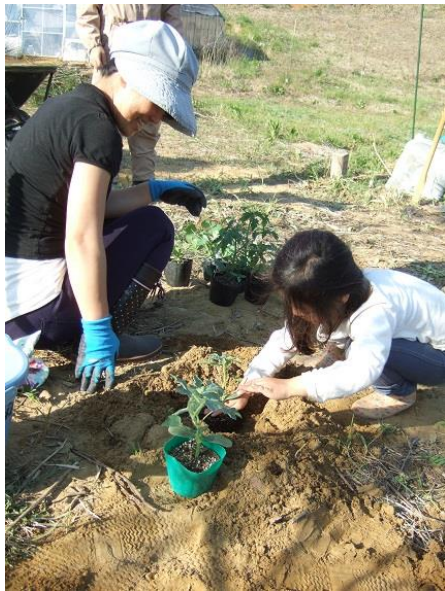
苗植えのお手伝い