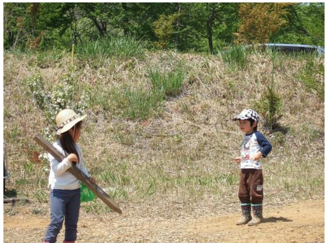
異年齢の子ども同士