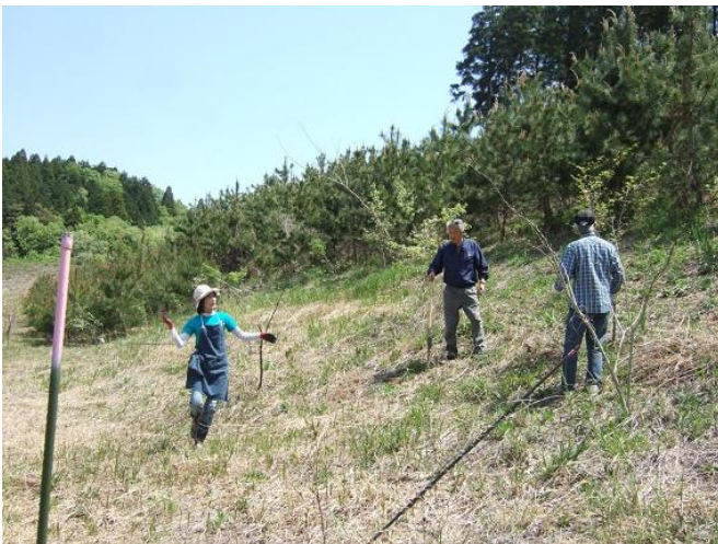
植樹祭メイン会場