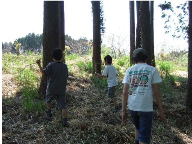
山菜あるといいな！