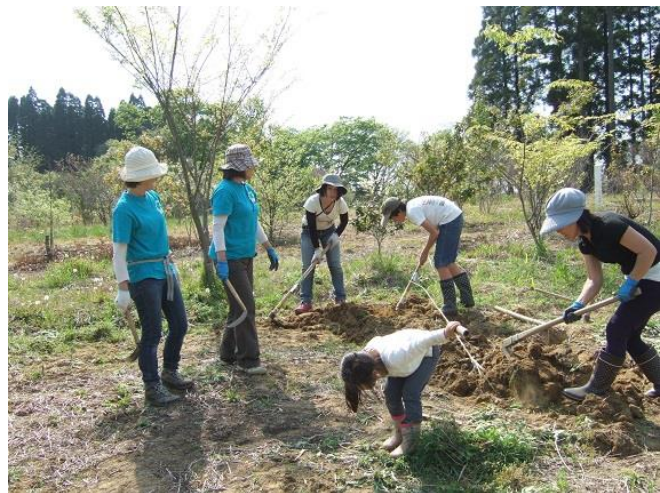
土づくり・畑作りにみんなで取りかかる