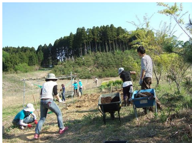
最後に堆肥を入れて