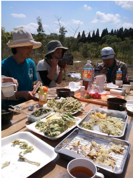
揚げたての山菜てんぷら