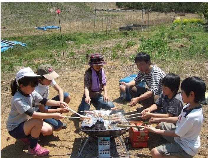
竹くしあぶりハンバーグを美味しく焼こう！