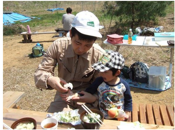
山菜づくしのお昼はどうですか？