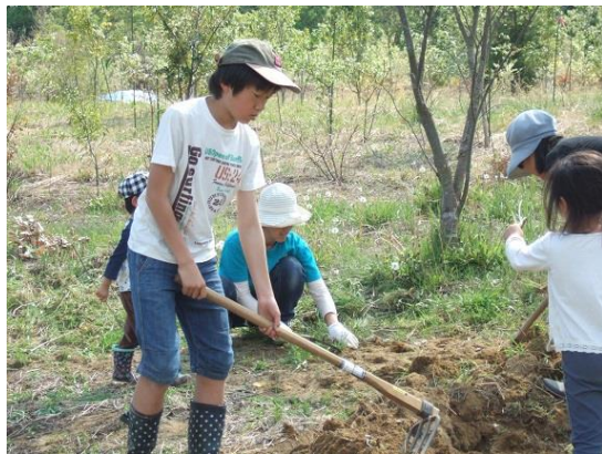
三本鋤で畑の耕起作業に挑戦