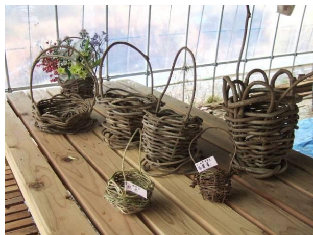
抜井先生による事前指導会と作品