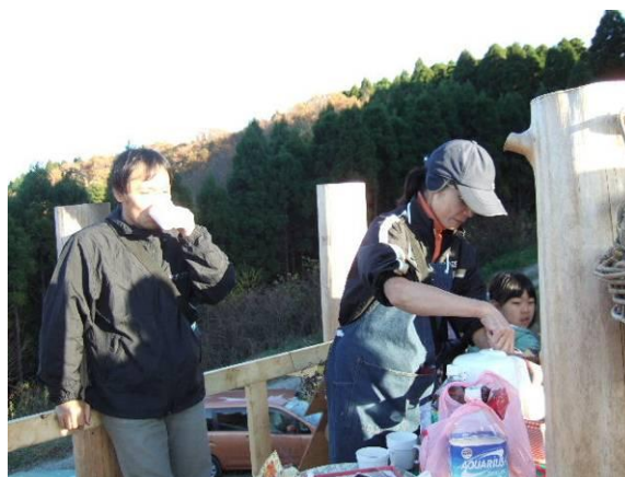
ようやく完成したツリーハウスの上で一足早いクリスマスパーティー