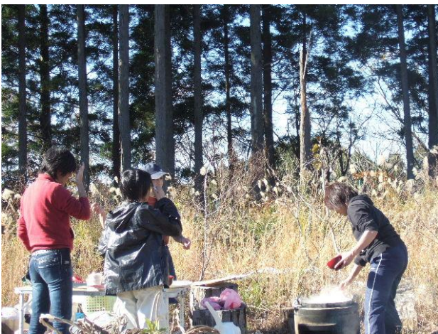
おいしくておかわり