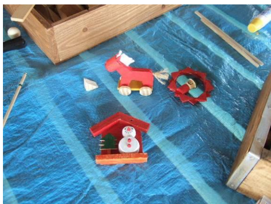
オーナメント作品