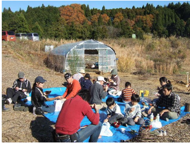
みんなで博多風水炊きを味わう