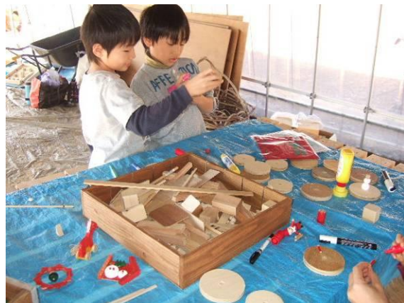
クリスマスオーナメント作り