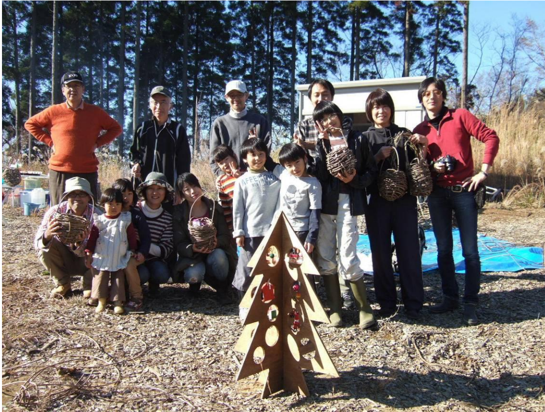
木製クリスマスツリーの前で集合写真