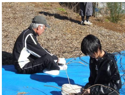
抜井先生がいない中での蔓籠作り