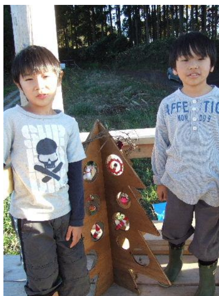
オーナメントを木製ツリーに飾る