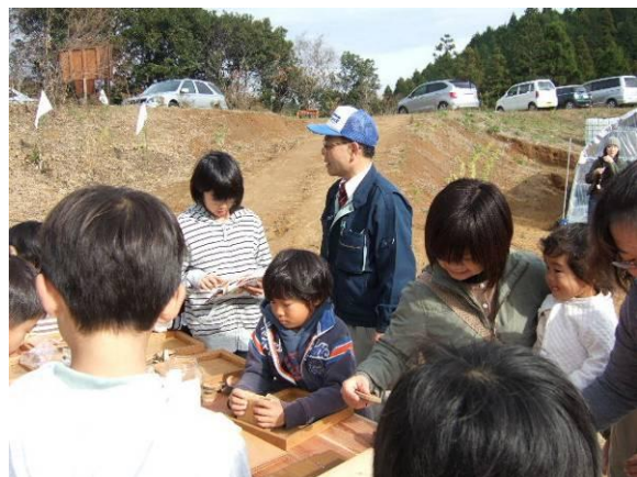
木目がおもしろい！