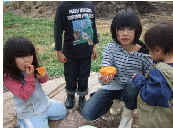
オレンジ色の焼き芋 おいしそう！