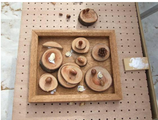
おいそうなケーキ・・・