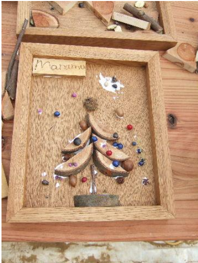
色とりどりの木の实を使って