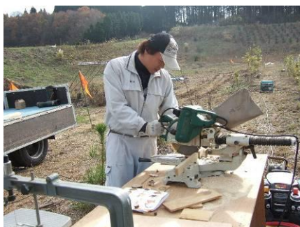
大工さんはカットがうまい