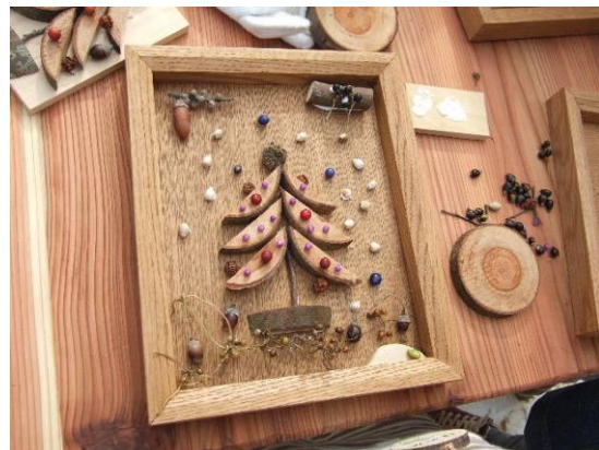
白いじゅず球が雪のよう