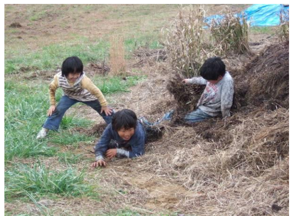
堆肥の山で鬼ごっこ