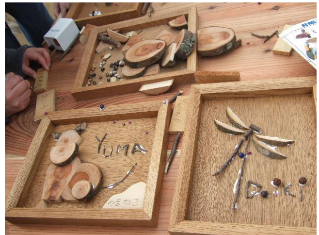
森に棲む動物 ヤマネコ、クマ、トンボ