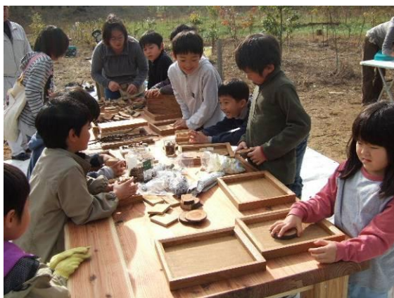
わあー！これ作りたい