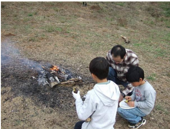
うまく焼けたかな？