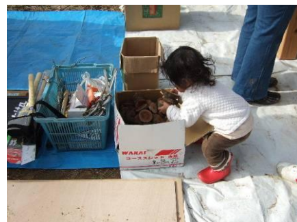
音ちゃんも材料選び